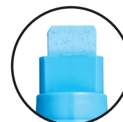
PC-17K ЕКСТРА ШИРОК 15 mm