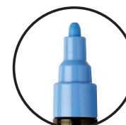
PC-5M СРЕДНО 1.8-2.5 mm