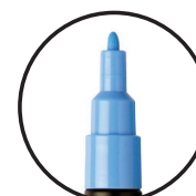
PC-3M ТЕНКО 0.9-1.3 mm