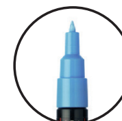
PC-1M ЕКСТРА ТЕНКО 0.7 mm