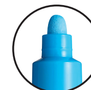
PC-7M КОНУСЕН ВРВ 4.5-5.5 mm