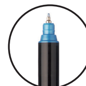
PC-1MR УЛТРА ТЕНКО 0.7 mm