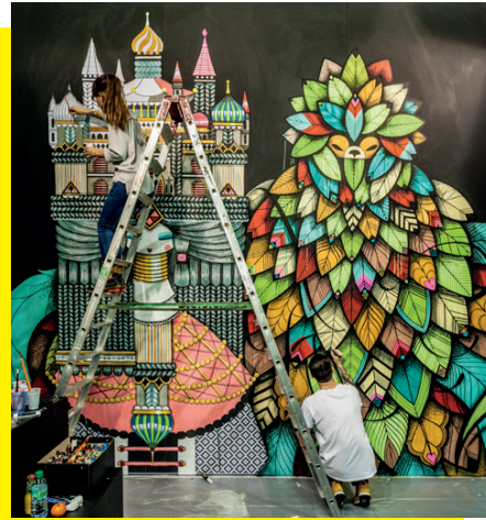
#SUPAKITCH & KORALIE