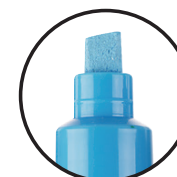
PC-8K КОСО СЕЧЕН ВРВ 8 mm