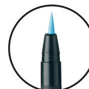
PCF-350 ЧЕТКИЧКА 1 - 10 mm